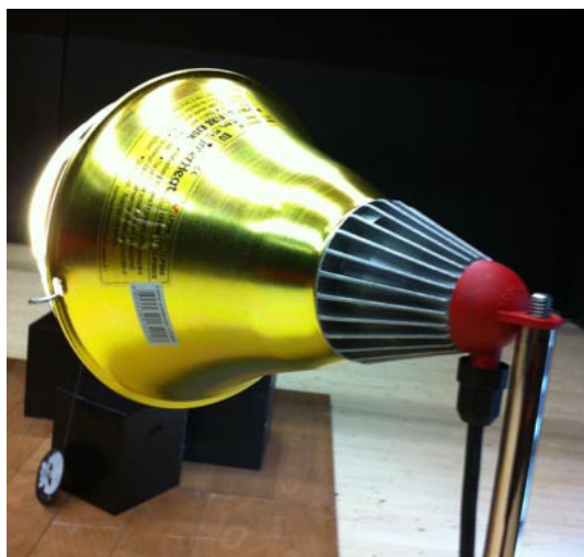
Le Petit Phil rouge // février 2014 // 5