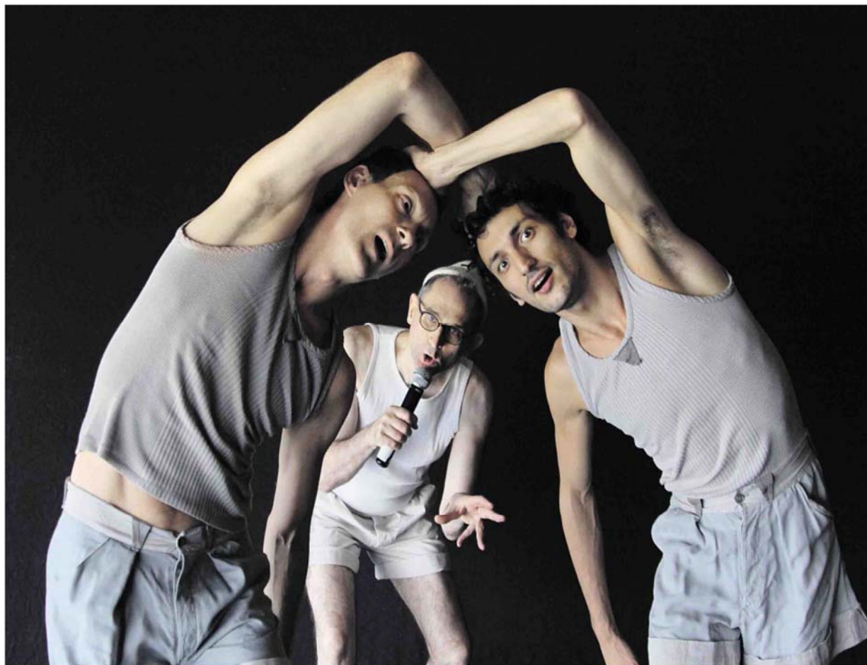
Jean-Claude Gallotta a adapté sa pièce iconique, « Mammame », en y injectant des éléments narratifs aux parties de danse. GUY DELAHAYE

Blanca Li et Jean-Claude Gallotta se tiennent aux deux extrémités de la cartographie de la danse française. La première, andalouse, gymnaste de formation, installée en France depuis 1993, appuyée sur le champignon de comédies chorégraphiques souvent théâtrales et multimedias, proches de shows. Le second, passé par les Beaux-Arts de Grenoble, figure de proue de la danse contemporaine depuis le début des années 1980, a forgé une écriture à nulle autre pareille, infiniment subtile dans ses articulations, irrédûctiblement vivante dans son élan. Bondissante et vive, brodée d'humours explosives, elle exacerbe la volubilité de corps en état d'urgence et cavale sur la piste d'émotions paradoxales. A première vue sans point commun, ces