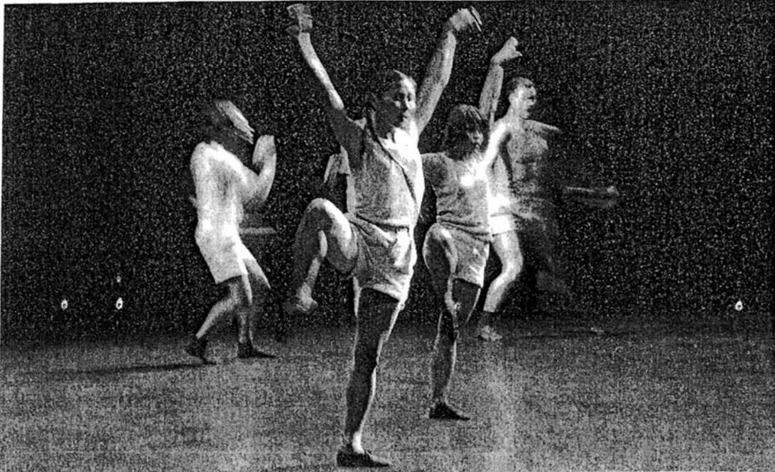
Se mouvoir pour un rayon de soleil.