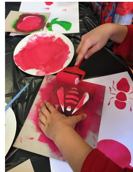
un atelier pochoir avec l'illustrateur Bastien Contraire