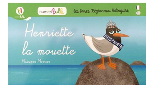
Henriette la mouette Rozenn ar gouelanig Numéribulle, 2015