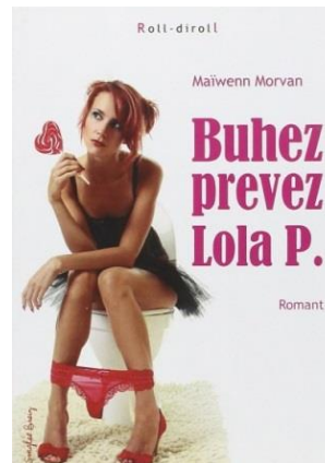
Buhez prevez Lola P Emgleo Breiz, 2010 (pour les adultes)