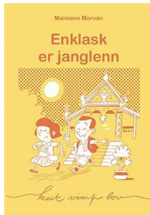
Enklask er janglenn Keit Vimp Bev 2018 2 ème prix « Priz ar vugale 2019 »