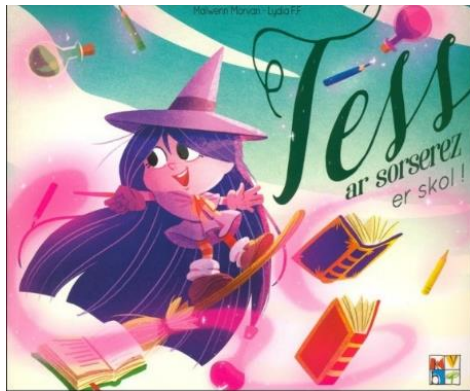
Tess ar sorserez: er skol Keit Vimp Bev, 2018