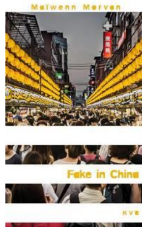
Fake in China Keit Vimp Bev, 2017 1 er prix « Priz ar yaouankiz 2018 »