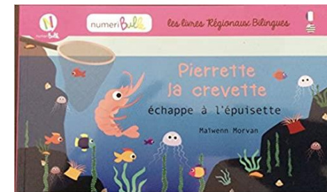
Pierrette la crevette échappe à l'épuisette Perezig ar chevrenn zo tec'het diouzh ar vazh-roued, Numéribulle, 2015