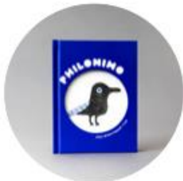
1 présentation de la collection Philonimo