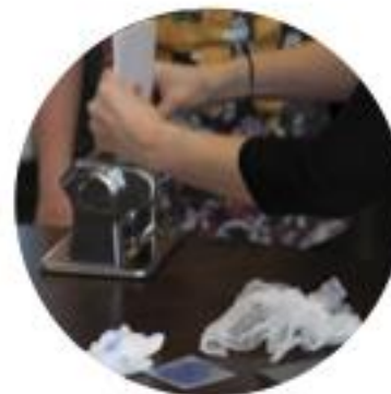
4 impression de la gravure

L'ensemble du matériel d'impression (plaques à graver, rouleaux, encre, papier) est fourni par l'illustratrice Csil