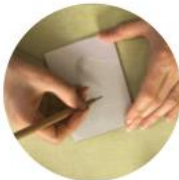
3 gravure et encrage de la plaque