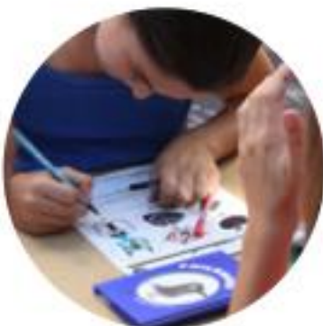
2 recherches et premier croquis du corbeau